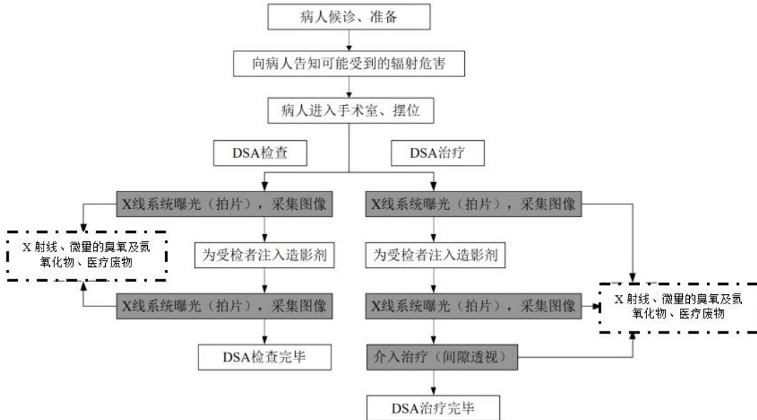
图 2-1 DSA 检查与治疗流程及产污环节示意图

本项目采用先进的数字显影技术，电脑成像，不使用显（定）影液，不产生废显影液、废定影液和废胶片。注入的造影剂不含放射性。设备运行过程中产生的污染物主要为 X 射线、臭氧、介入手术室通风系统机组运行所产生的噪声，以及手术过程中产生的医疗废物。